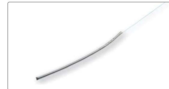
그림1. 분포형 온도감지기 내부