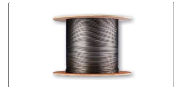
그림2. 분포형 온도감지기